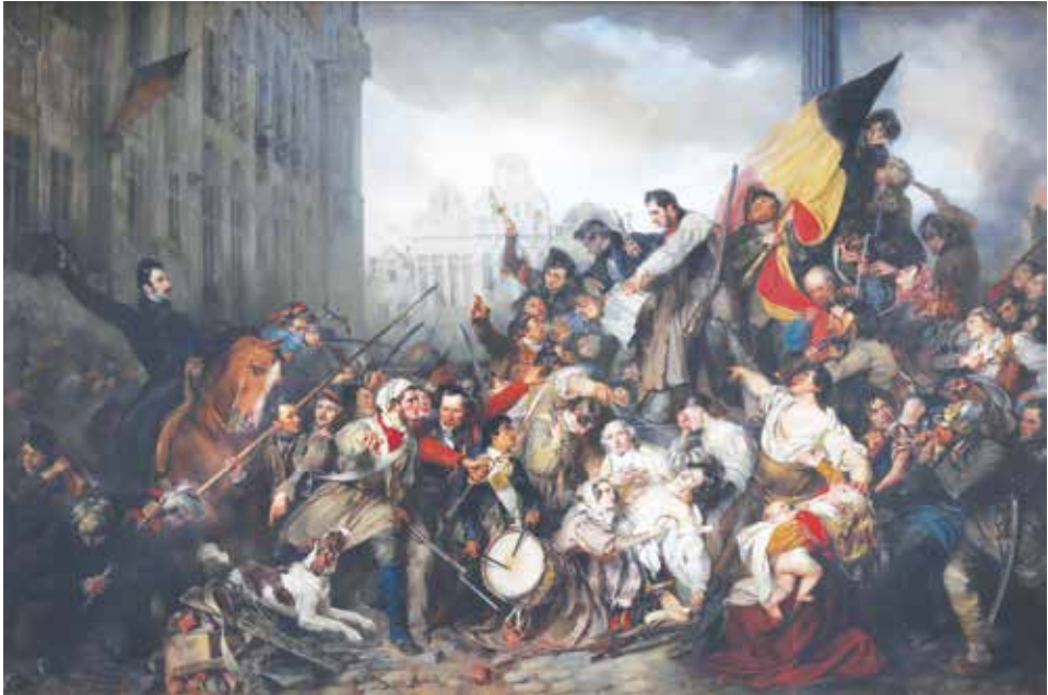
► “Tafereel van de Septemberdagen 1830 op de Grote Markt te Brussel”, een romantische uitbeelding van de Belgische Revolutie. Schilderij van Gustaaf Wappers, 1835 (Brussel, Koninklijke Musea voor Schone Kunsten van België).

Erasme Surlet de Chokier valt de keuze van een vorst ten slotte op Leopold van Saksen-Coburg, die op 21 juli 1831 de eed aflegt als eerste 'koning der Belgen'.